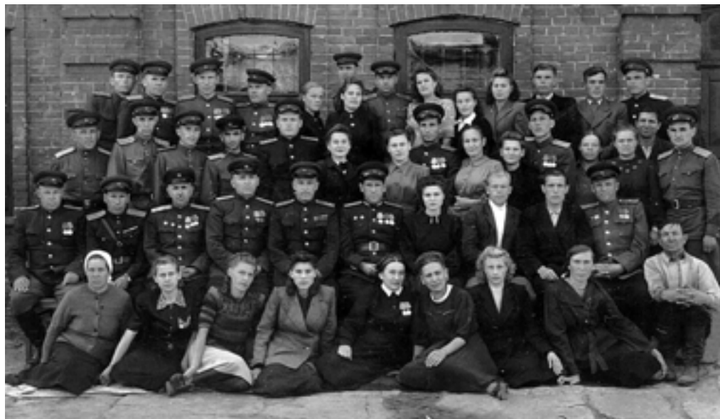
Коллектив областного военного комиссариата. 1947 год.