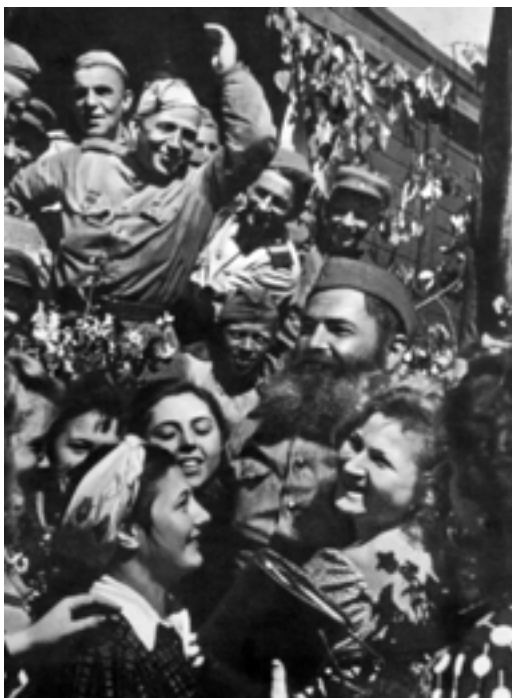
Встреча победителей. 1945 год.

Откуда взялись эти миллионы? Известно, что по состоянию на 22 июня 1941 года в Красной Армии были 4 миллиона 827 тысяч человек. За 4 года войны были мобилизованы 29 миллионов 575 тысяч человек. Всего, таким образом, общее отвлечение людских ресурсов на войну составило 34 миллиона 402 тысячи человек. Если учесть, что, по данным переписи населения СССР 1939 года, в народном хозяйстве были заняты 33 миллиона 900 тысяч рабочих и служащих и 29 миллионов колхозников, то становится очевидным, что экономика страны недосчитывала 60 процентов самой трудоспособной части населения. Если же в дополнение к этому принять во внима-