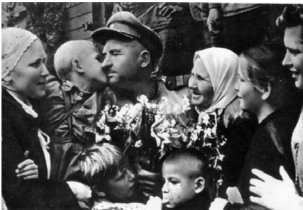
Возвращение домой. 1945 год.

4 сентября 1945 года был упразднен Государственный Совет Обороны. Прекратила свою деятельность Ставка Верховного Главнокомандования.