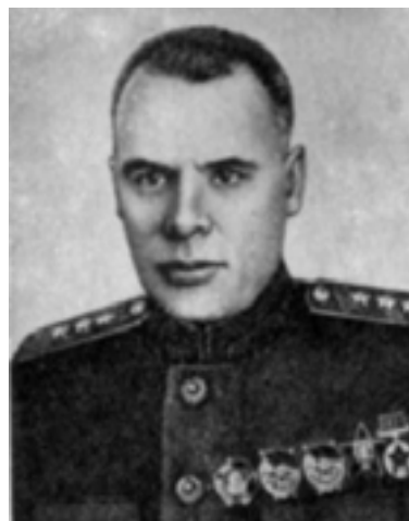
Кузнецов Федор Исидорович