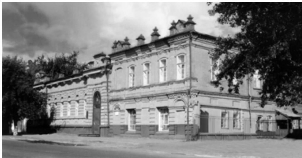
Здание областного военного комиссариата.

Велась работа по представлению к правительственным наградам воинов, павших на фронтах и не отмеченных наградами, по розыску лиц, награжденных орденами и медалями, но не получивших их. «Награда нашла героя» – под