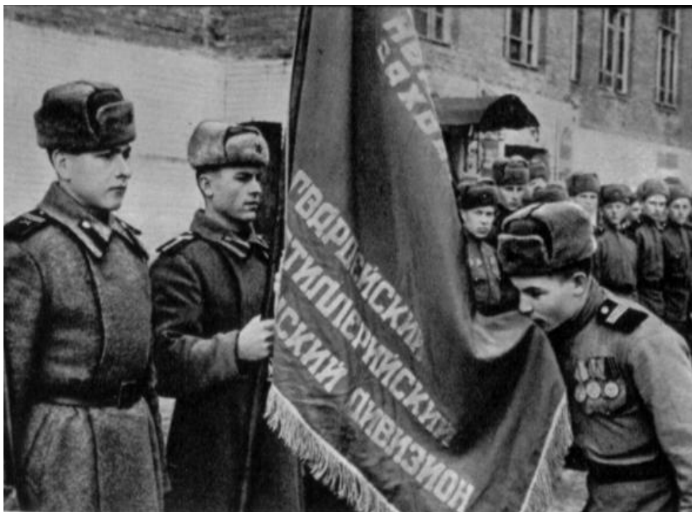
Проводы демобилизованных воинов. 1945 год

Ессентуки, Железноводск и Минеральные Воды увольнение разрешалось только лицам, проживавшим в этих городах до призыва на военную службу. Демобилизованные карачаевцы, калмыки, чеченцы, ингуши, балкарцы, крымские татары и болгары, греки направлялись по месту расселения их семей или родственников.