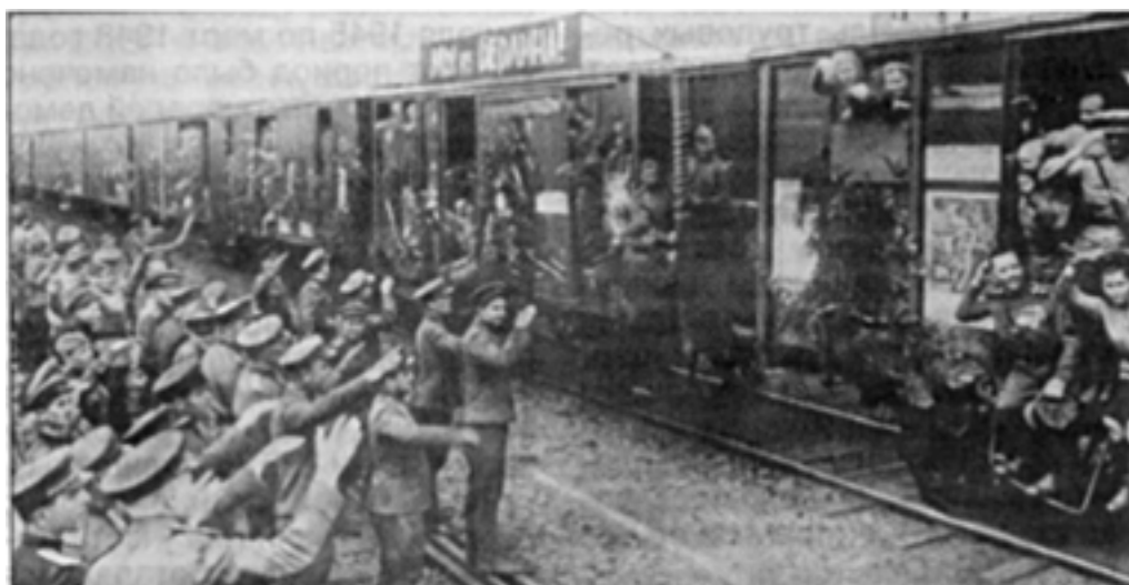
Первый эшелон демобилизованных советских воинов отправляется на Родину. Берлин. 1945 год